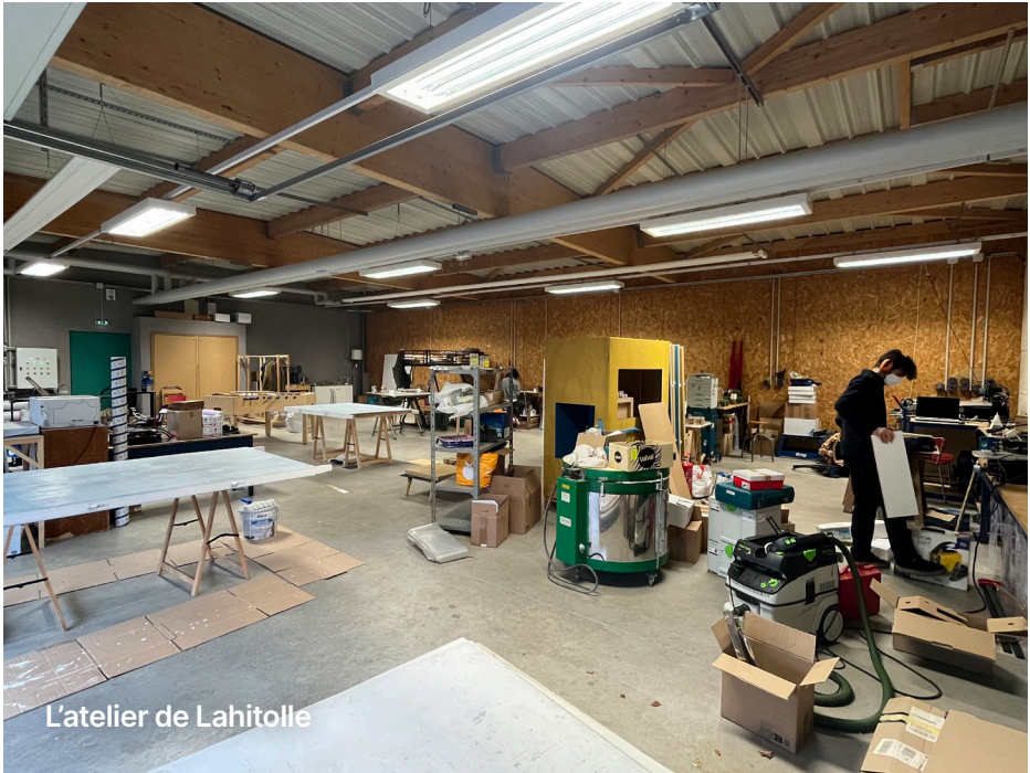
L'atelier de Lahitolle